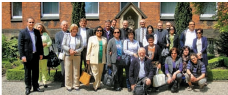
Udeleženci junijskega sestanka v Fuldi