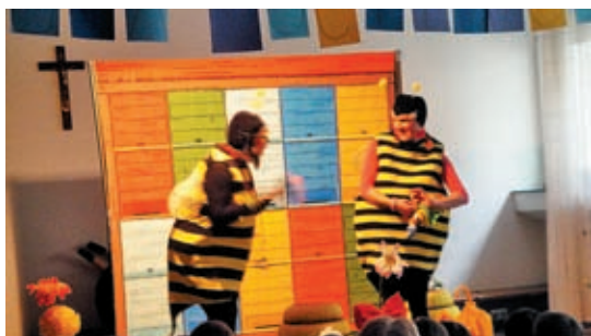
Čebelici iz gledališča KU-KUC