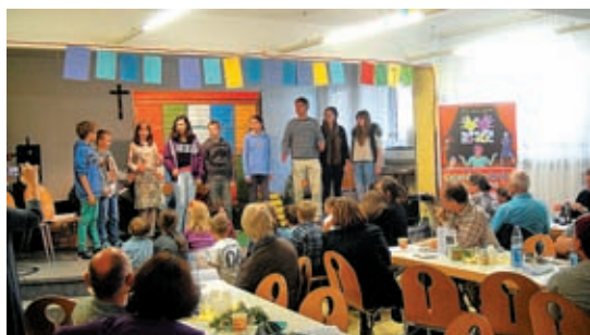
Del učencev med zaključnim nastopom