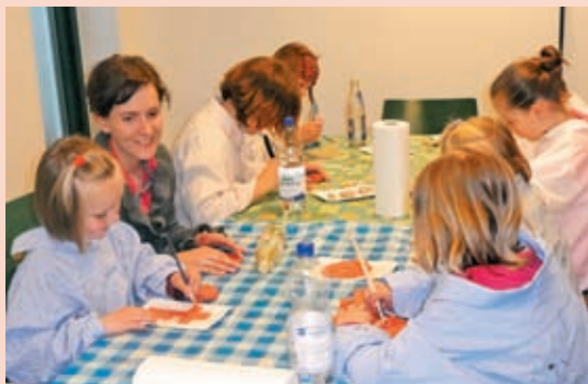
Otroci delajo svoje izdelke