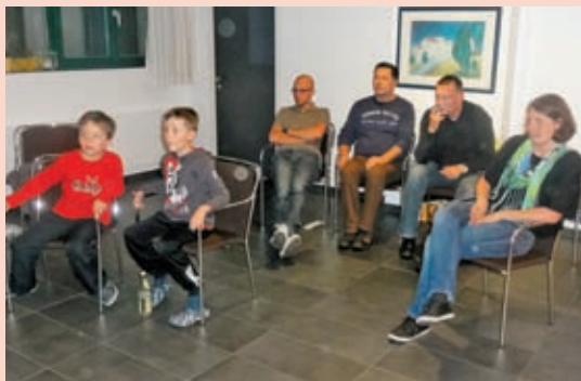
Zbrano občestvo ob gledanju nemškega nogometnega pokalnega finala