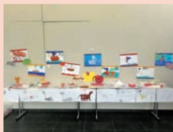
Izdelki otrok na razstavi