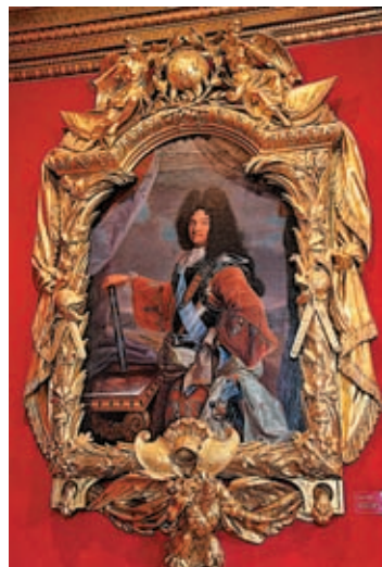
Sprejel nas je sam Ludvik štirinajsti.

Grad Villandry s čudovitim vrtom, ki ga obdaja, nas je očaral: estetsko urejene gredice, raznovrstne vrtnine, različno cvetje in botanične rastline. Vrt slovi kot edinstven v Evropi tega stila. Presenetile so me številke. V parku je posajenih 1015 lipovih dreves in 115000 različnih sadik posadijo vrtnarji vsako leto v določene kvadrate, saj je vrt porazdeljen simbolično na devet kvadratov in vsak nosi svoje