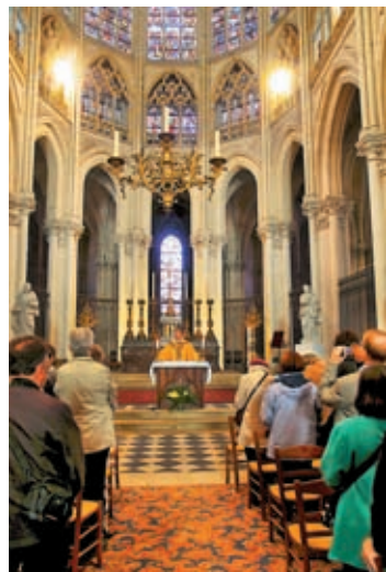
Vnebohodno praznovanje v stolnici sv. Martina v Toursu

Dospeli smo do gradu in njegovih vrtov Villandry ob predvidenem času. Ob prihodu na cilj smo se najprej okrepčali in po kosilu se je dež nenadoma pomiril. Sledilo je idealno vreme skozi ves čas bivanja v tem zgodovinskem predelu francoske dežele.