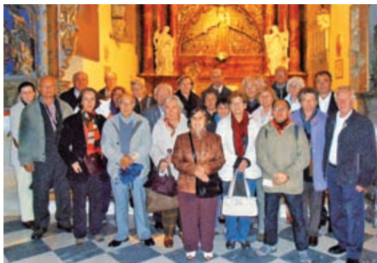
Na Ptujski Gori

cem smo si ogledali na novo zgrajeno cerkev in samostan ter obisk zaključili v njihovi kleti, kjer nas je čakalo pravo presenečenje. Pripravili so nam namreč zakusko, pri kateri seveda ni manjkalo odlične vinske kapljice iz njihovih vinogradov.