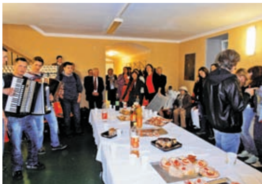
Druženje po sv. maši