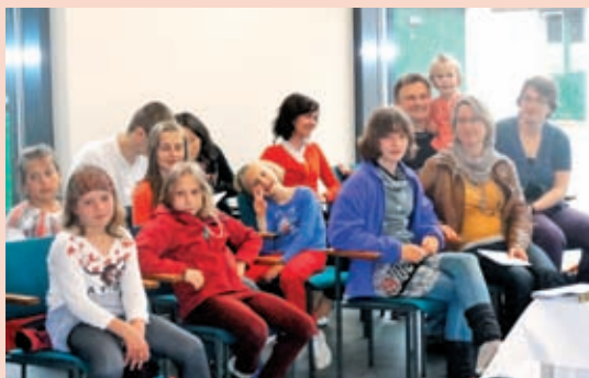
Priprave pred sveto mašo