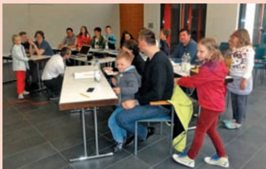
Pogled na zbrane družine v dvorani