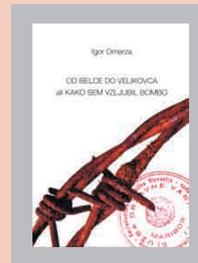
Celovška Mohorjeva družba je izdala knjigo Igorja Omerze Od Belce do Velikovca ali kako sem vzljubil bombo .