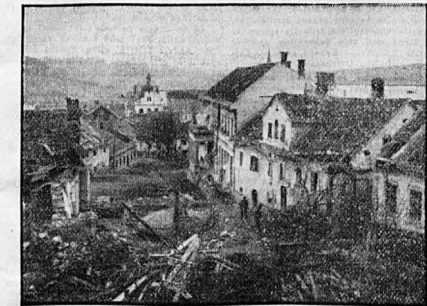
Pogled na Florjanov trg

Tokrat približujemo poleg fotografij o sedanjem stanju mesta še podatke o najvidnejših sadovih osvobodilnega boja in njegovih posledicah v Novem mestu.