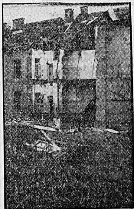
V ženski bolnišnici je našlo smrt 16 ljudi

Po teh neuspehih so komunisti 14. novembra poslali v Novo mesto parlamentarca iz