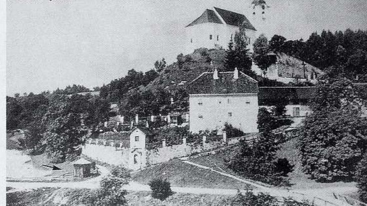
Zgornje Stranje med obema vojnama

je mamo tako izčrpal, da je verjetno zato čez tri mesece zbolela na pljučih.