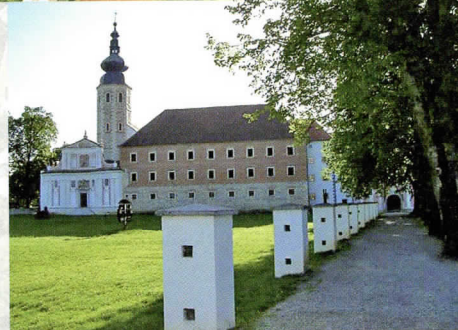
V samostanu je galerija Božidarja Jakca.

Kot gozdarski strokovnjak in izumitelj je nekaj časa tu živel Josef Ressel (1793–1857), ki je na Krki pri Dobravi leta 1820 preizkušal ladijski vijak . V spomin na življenje in delo velikega moža, ki je priznanje za svoje številne dosežke dobil šele po smrti, so v Tehniškem muzeju Slovenije v Bistri pri Vrhniki pripravili občasno razstavo z naslovom Josef Ressel - Od vijaka do junaka , ki je na ogled do 3. decembra 2007. D