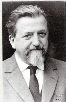
Slikar Božidar Jakac