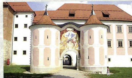
Samostan je sakralno funkcijo izgubil leta 1786.