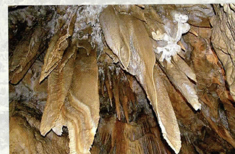
Lepote Kostanjeviške jame