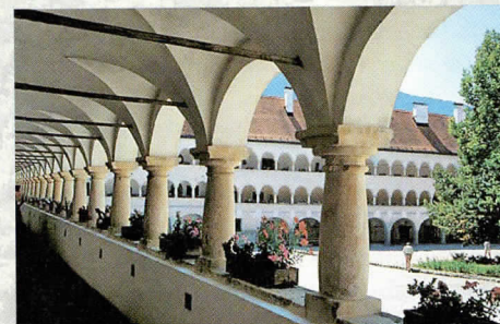
Arkade cistercijskega samostana