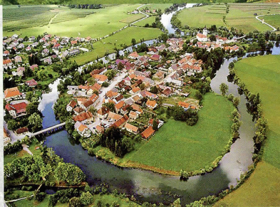
Kostanjevica na Krki leži na umetnem otoku.

ski baročni samostan je sakralno funkcijo izgubil z jožefinsko odpravo leta 1786. Oltarje in drugo cerkveno opremo so raznesli ali razprodali. Samostan je počasi propadal. Leta 1942 je bil požgan. Po letu 1958 so vztrajno prenavljali trakt za traktom. Cerkev so rekonstruirali do leta 1971.