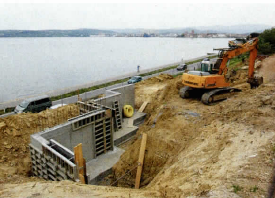
Luksuzno vilo so začeli graditi leta 2013, zasnoval jo je arhitekt Aleš Šeligo.