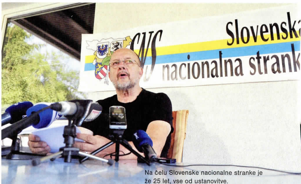
Na čelu Slovenske nacionalne stranke je že 25 let, vse od ustanovitve.