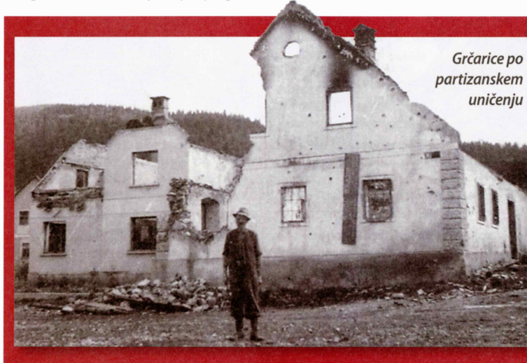
Grčarice po partizanskem uničenju

objavil odlomke zapisnikov zaslišanj ujetnikov, ki pa – objavljeni brez poudarjenih opozoril, da gre za »zapisnike«, narejene pod smrtno grožnjo, ali brez natančnih komentarjev –, lahko pri bralcu povzročijo več škode kot koristi. Na podatke v »zapisnikih« in v »sodbi« se namreč nikakor ne moremo zanesti, saj so prirejani ali celo neresnični. Pogosto so