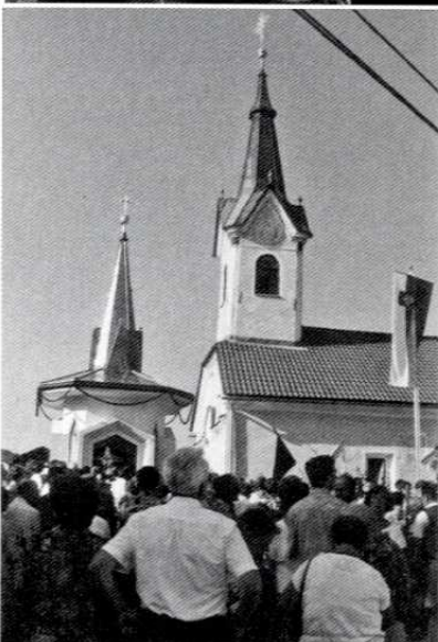
Na blagoslovitev spominske kapelice v Šentjoštu 9. julija 1995 je prišlo okoli 3000 ljudi.

koliko žrtev so imeli. Največjo napako, ki so jo naredili partizani, je bila, da so zažgali poslopje okrog postojanke, ker so si s tem onemogočili približevanje. Borba je trajala od enajstih zvečer do šestih zjutraj. Med stražarji nismo imeli nobenega ranjenca.