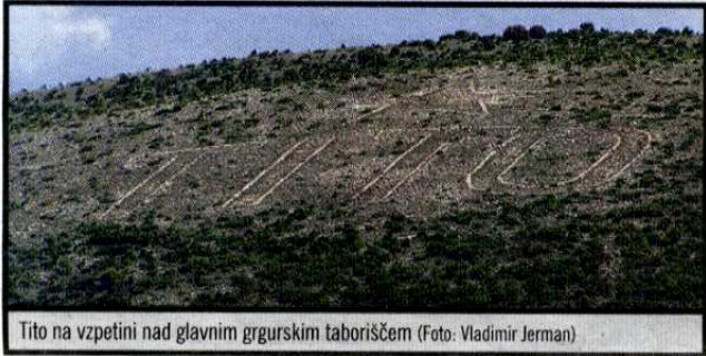
Tito na vzpetini nad glavnim grgurjskim taboriščem

Dragojević je nadziral Hrasta po prispetju na otok, ko je nekaj časa pekel kruh; bil je prvi golootoški pek, dokler niso med zaporniki prispeli pravi peki: »Delali so majhne črne hlebčke za zapornike, bel kruh za upravo.« Izčrpani Hrast je bil na Golem na robu smrti tudi dobesedno, a se je iz dolge nezavesti zbudil in preživel. Tam so ostali vsi njegovi zobje, spoznal pa je to: »Nikoli ne izgubi upanja, ne premlevaj o brezizhodnosti. Čeprav sem doživel marsikatero krivico, v meni ni sovraštva. Tudi vi ne kujte maščevanja – kar te živčno izčrpa, da propadeš – ampak maščevanje prepustite usodi. Bodite srečni s tem, kar živite.«