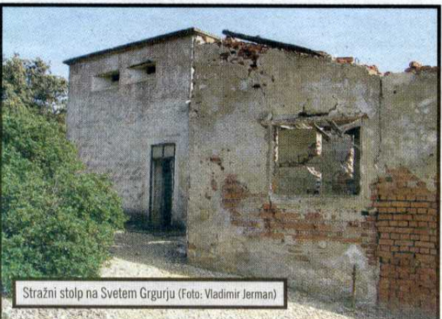
Stražni stolp na Svetem Grgurju