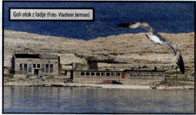
Goli otok z ladje

Hrane jim je primanjkovalo, bili so živi okostnjaki. Neverjetno, a je bilo celo to za kaj dobro: »Ljudje so prišli z želodčnimi čiri in boleznimi. Že prvi mesec podhranjenosti niso bili več bolni.« Hrast, zakladnica življenjskih modrosti, nam je zaupal nauk: »Zmerni bodite pa pošteni.« Med zaporniki je smrt kosila zaradi fizične in psihične izčrpanosti. Hrusta je iz najbolj črnega obupa reševala misel, kako neizmerno ga ljubi mama. Dvakrat je že bil na tem, da stori samomor, podobno kot so ga številni