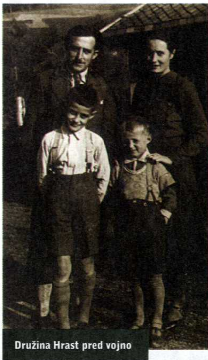
Družina Hrast pred vojno

Ob očetovem rojstnem dnevu smo v šoli plesali in župnik je naredil velik halo, kako lahko pri nadučitelju plešemo brez njegovega dovoljenja. Takrat se je župnik, pa tudi vsa katoliška cerkev, tako kot danes, vtikala v vse, zganjala je pravi teror nad ljudmi.