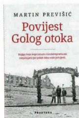
Martin Previšić Povijest Golog otoka Fraktura, 2019., 634 str.

le su ratne igre na granicama, mobilizacija rezervista i ratna psihoza.