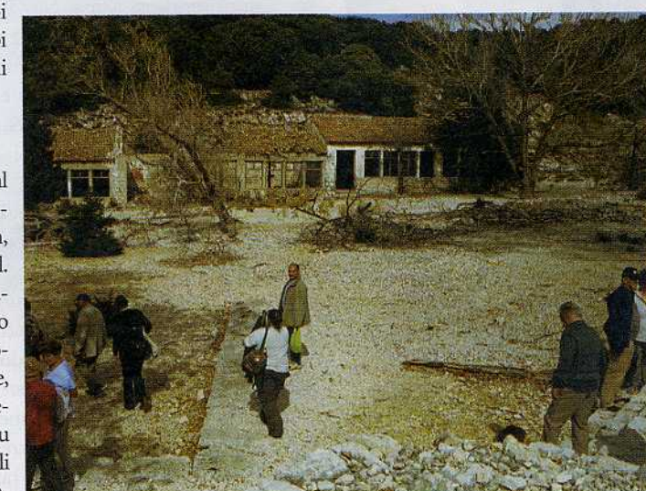
Danes nekdanjo udbovsko mučilnico na Svetem Grgurju obiščejo le redki ljudje.