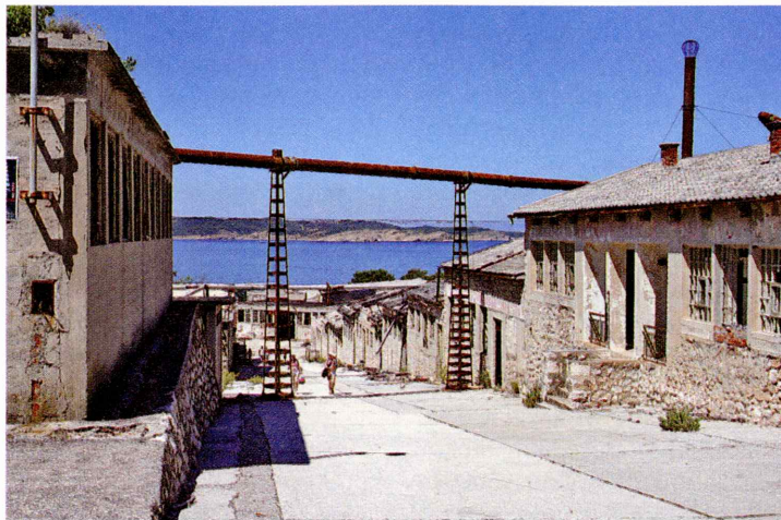
Goli otok je danes muzej. Spominja nas na sramotno preteklost.

napravili samomor. Stari zaporniki so morali pod vodstvom in nadzorom vodij »samouprave« sodelovati v vseh šikaniranjih sojetnikov, sicer so se tudi sami spet spustili na raven bojkotira-