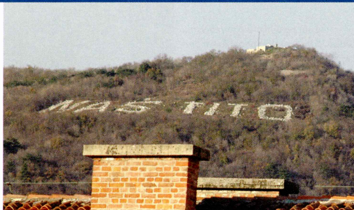
Napise Naš Tito so iz kamnja prisilno sestavljali tudi na Golem otoku.

ob že tako dolgem in težkem običajnem delavniku, poniževali so jih bolj kot običajno. Vse skupaj je seveda požegnala uprava taborišča, ki se v »samoupravo« uradno ni vmešavala. Pretepanje bojkotiranih je bilo običajno, pravzaprav so uvedli navado, da so vse novoprispelle zapornike premlatili na žive in mrtve že kar ob prihodu. »Na mrtve« je mišljeno dobesedno, kajti zgodilo se je, da je kdo res podlegel udarcem, bili pa so tudi primeri, da so zaporniki preprosto ponoreli in