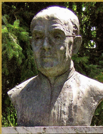
Janez Jalen (1891–1966)