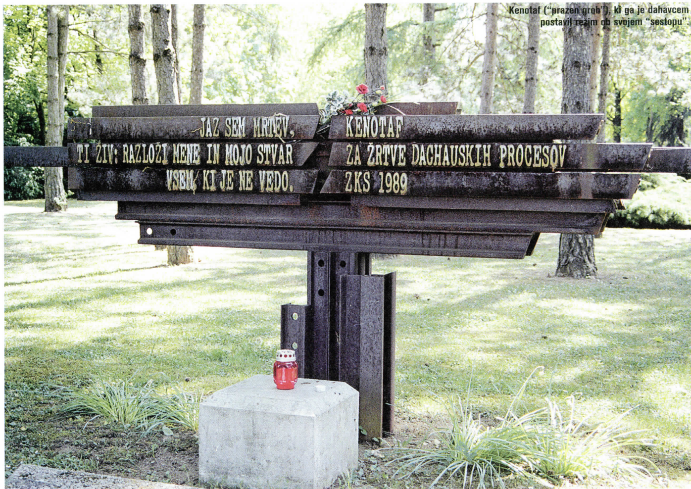
Kenotaf ("prazen grob"), ki ga je dahavec postavil režim ob svojem "sestopu".