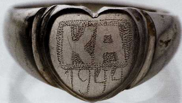
Prstan, ki so ga našli med izkopavanjem grobišča pri Slovenski Bistrici

V Sloveniji so po vojni ubijali tudi pripadnike drugih narodov, največ pripadnike oboroženih sil Neodvisne države Hrvaške (hrvaške ustaše in domobrane), pripadnike Srbskega dobrovoljskega korpusa, črnogorskih in drugih četnikov ter tudi civilistov, ki so se umikali z oboroženimi enotami čez Slovenijo na Koroško. Kaže, da je grobišč, v katerih so osebe neslovenske narodnosti, več kot "slovenskih". Kljub številnim "maršem smrti" po nekdanjih jugoslovanskih pokrajinah, kjer so končali vrnjeni in zajeti vojaki in tudi civilisti, jih večina leži na slovenskem ozemlju. Med evidentiranimi grobišči jih je 108 s Slovenci, 84 s hrvaškimi žrtvami in 61 z nemškimi. V 59 grobiščih so skupaj žrtve različnih narodnosti, za 62 pa ni nobenih podatkov o narodnosti. Za natančnejšo raziskavo bi jih bilo treba strokovno izkopati in pri tem narediti vse potrebne analize. V povojnih pobo-