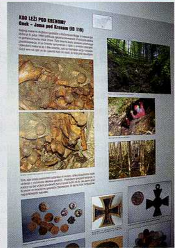
Pano Kdo leži Pod Krenom prikazuje izsledke raziskave iz lanske jeseni, ki je potrdila, da so v tem grobišču verjetno pobiti pripadniki drugih narodnosti.

na sodišča. Proglašena bo nova amnestija. Nimate torej nobenega razloga biti tako počasni v čiščenju kot doslej." Kardelj je v tej depeši uporabil izraz "čiščenje", ki je v tistem času pomenil samo eno: aretacije, umore, pomore, skratka, radikalno odstranjevanje političnih nasprotnikov. Tisti, ki so se do zdaj izgovarjali, da slovenski komunisti niso organizirali pomorov in da zato zanje niso odgovorni, saj da za kaj takšnega ni dokazov, in da jih je torej izvajal nekdo drug (npr. "jugoslovanska armada"), so zdaj končno dobili toliko potrebni in odločilni "dokaz". Komunisti in njihovi partizani so med vojno pobili na tisoče Slovencev, po vojni pa še več, kljub temu pa si nekdo drzne govoriti o nekakšnih dokazih za to.