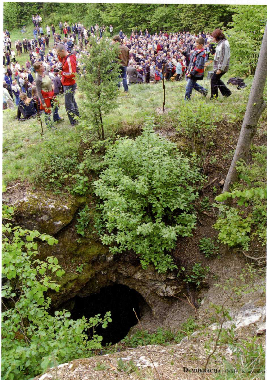
Šemonovo brezno na robu Logaškega polja