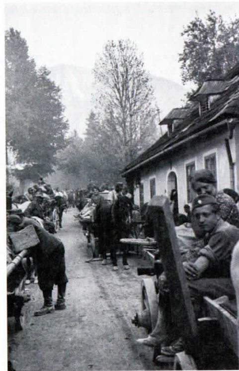
Begunci se z dolgimi zastoji prebijajo skozi Tržič.