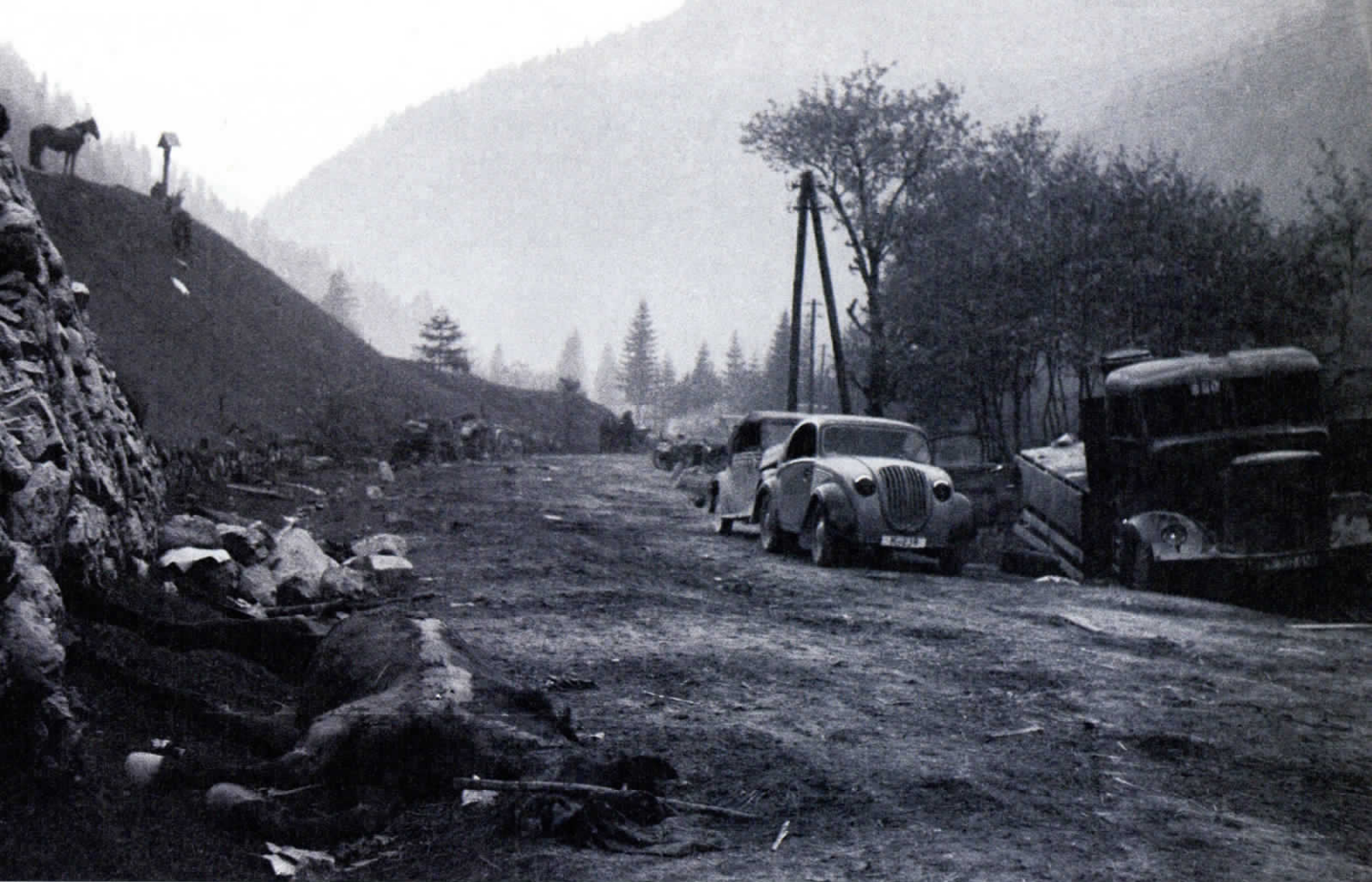
Razdejanje na begunski poti onstran Ljubelja na koroški strani proti Borovljam