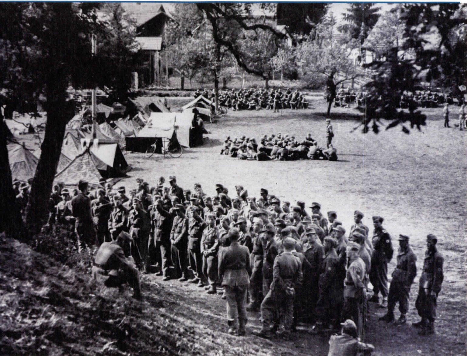
Domobranci v vetrinjskem taborišču pri Celovcu pred velikim zločinom Britancev in partizanov