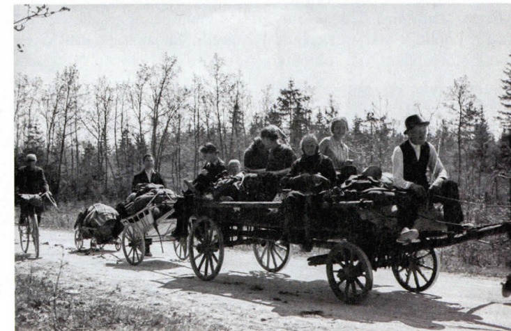
Begunci si rešujejo življenje pred morilskimi partizani.