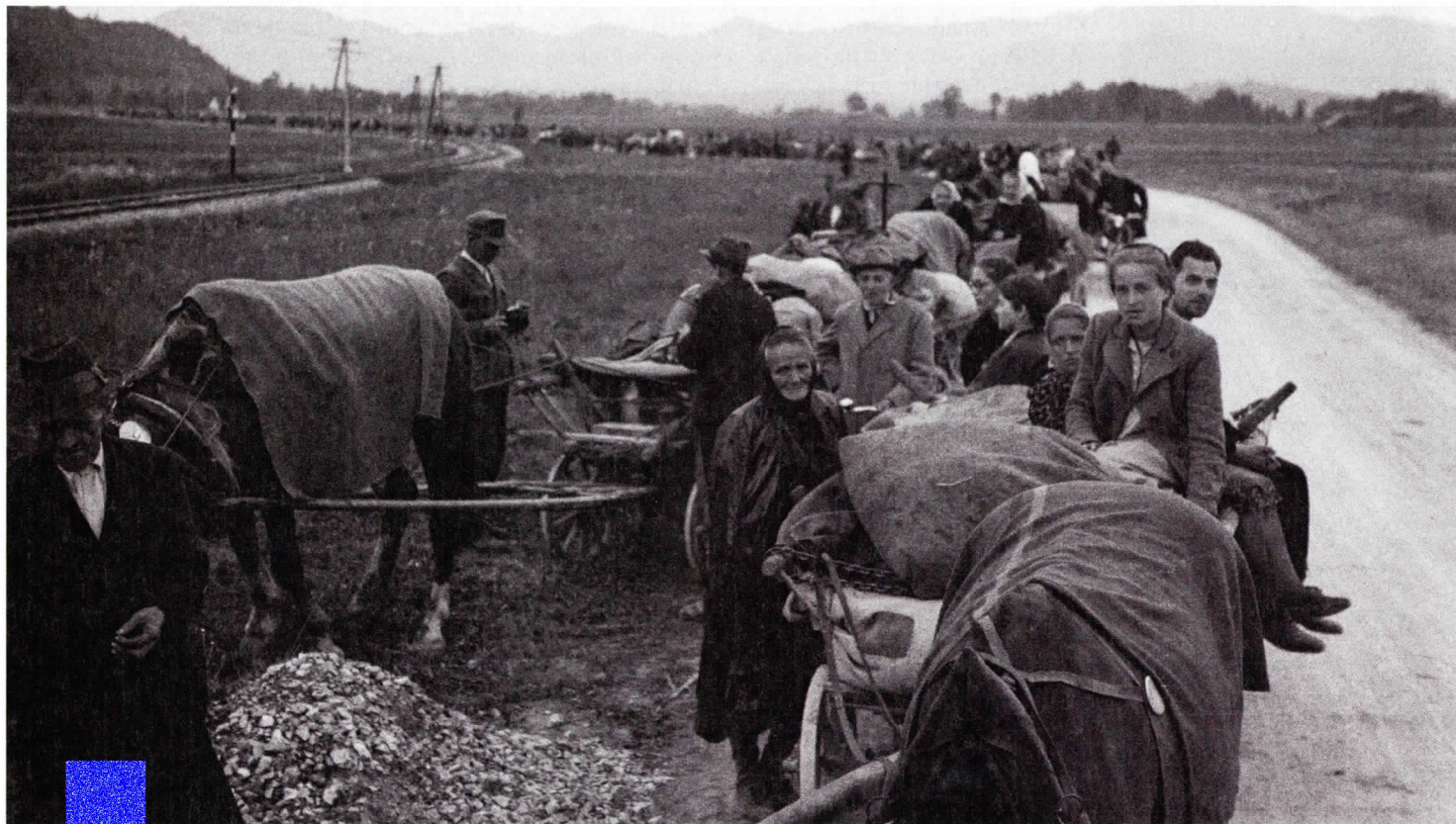
Dolge so bile kolone beguncev pred nasiljem revolucije.