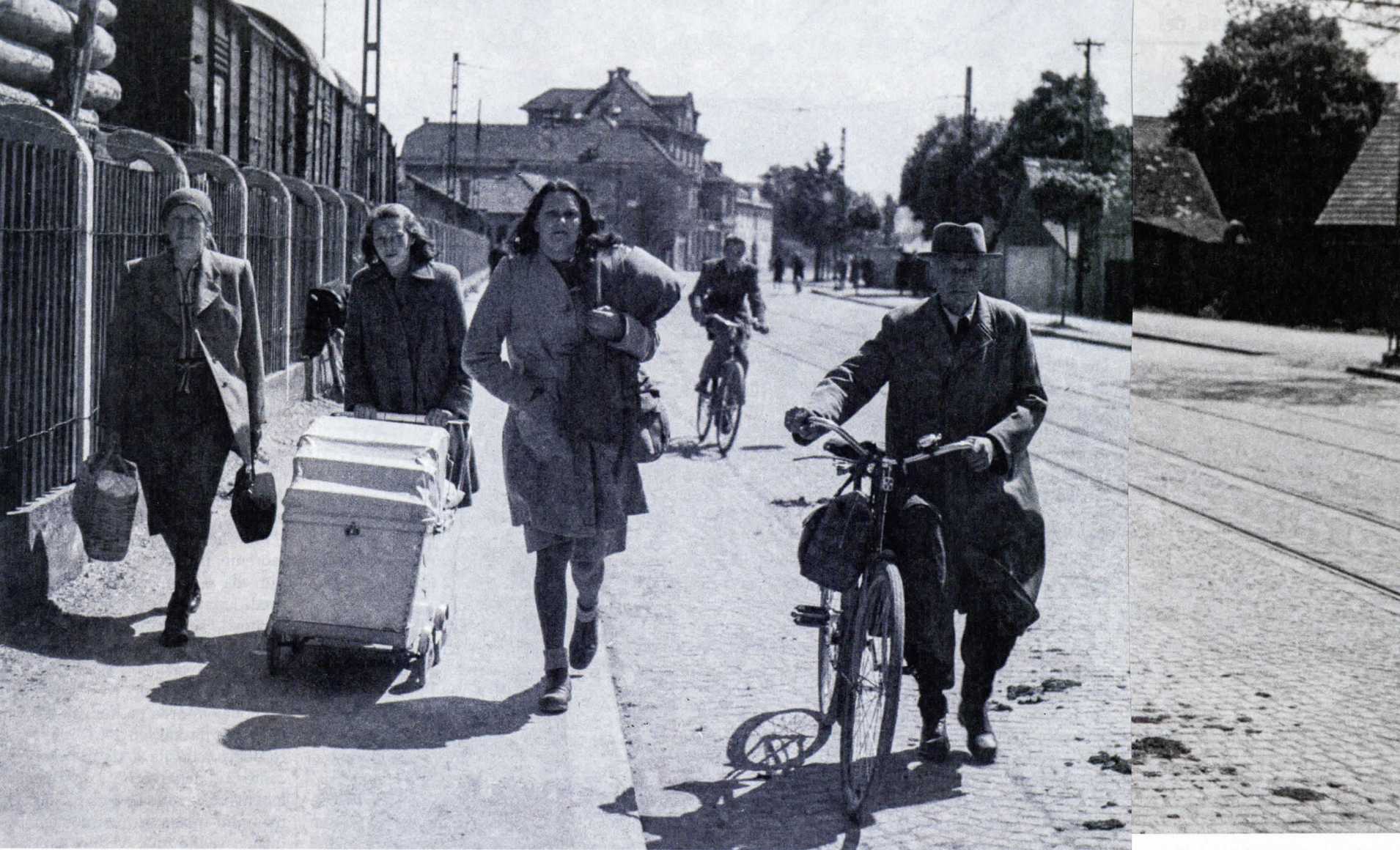
Kocmurjevi na Masarykovi cesti pri ljubljanski železniški postaji v soboto 5. maja 1945