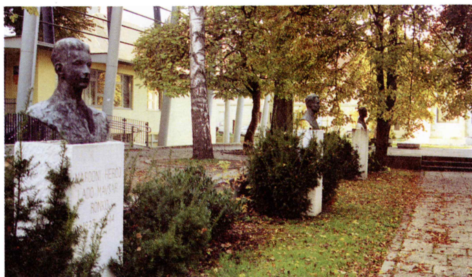
Trije doprnski kipi "narodnih herojev" ob velikem spomeniškem kompleksu, ki so ga v času komunizma postavili tik ob župnijski cerkvi v Slovenj Gradcu. Revolucija kot konkurenca Cerkvi?