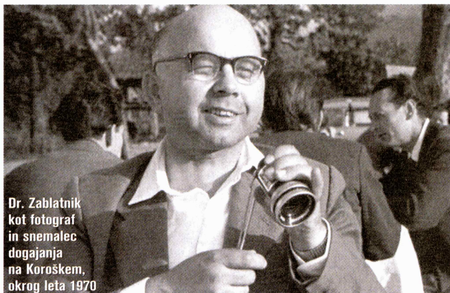
Dr. Zablatnik kot fotograf in snemalec dogajanja na Koroškem, okrog leta 1970