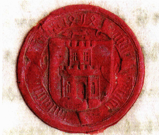
Pečat ljubljanskih županov iz 16. stoletja