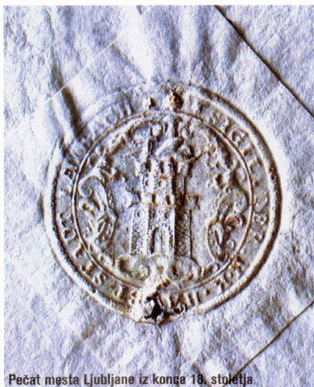
Pečat mesta Ljubljane iz konca 18. stoletja