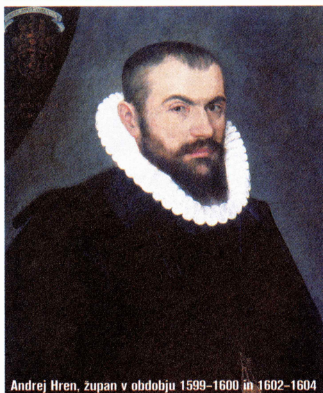
Andrej Hren, župan v obdobju 1599–1600 in 1602–1604