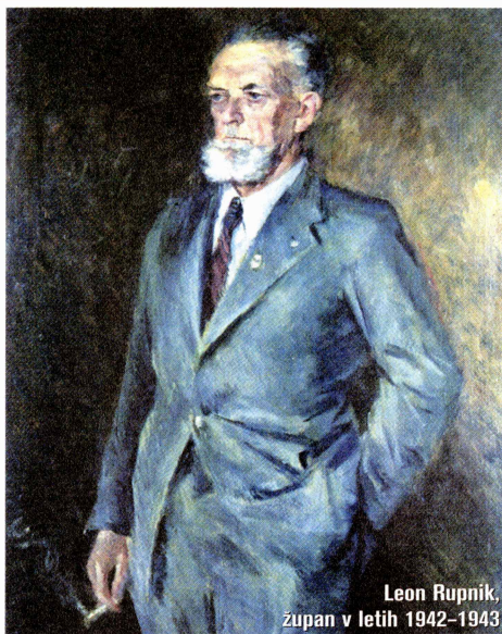
Leon Rupnik, župan v letih 1942–1943