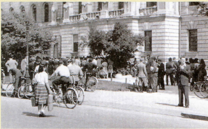
Za široke ljudske množice so oblasti prenašale potek procesa prek zvočnikov.