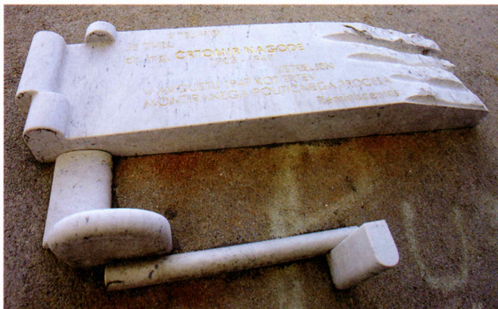
Spominska plošča na hiši družine Nagode

Končno je sledil veliki finale pred sodiščem. Tožilstvo kot podaljšana roka politične policije je imelo vse karte v svojih rokah in je suvereno obvladovalo procese. Določalo je, kdo bodo pričë, kdo se sme in kdo se ne sme pojaviti pred sodnim tribunalom, dajalo je tudi direktive tistim sodnikom, ki morda še niso dojeli duha novega časa in so bili še vedno omejeni z buržujskim sistemom sojenja in iskanja krivde oziroma nekriv-