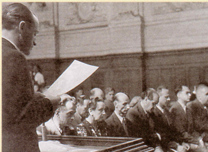
Komunistični javni tožilec Viktor Avbelj bere obtožnico.