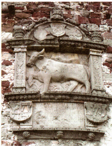
Plošča na t. i. volovskem stolpu priča o domnevni postavitvi Turjaka leta 1067 in njegovi obnovi po velikem potresu leta 1511.

Na podlagi tega teoretičnega dela sledi predstavitev konkretne plemiške rodbine – Auerspergov. Prvi del zajema rodbino v srednjem veku. Tu je razgrnil številne teorije o mo-