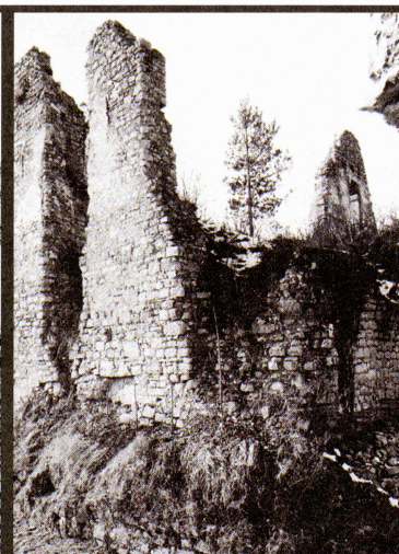
Vzhodna stran razrušenega palacija leta 1993