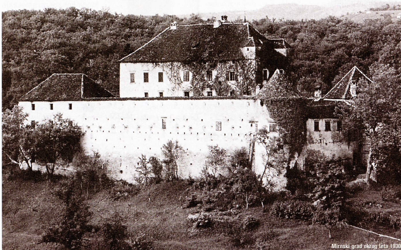
Mirnski grad okrog leta 1930