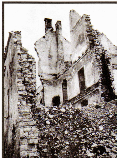
Razrušeni palacij mirnskega gradu leta 1947