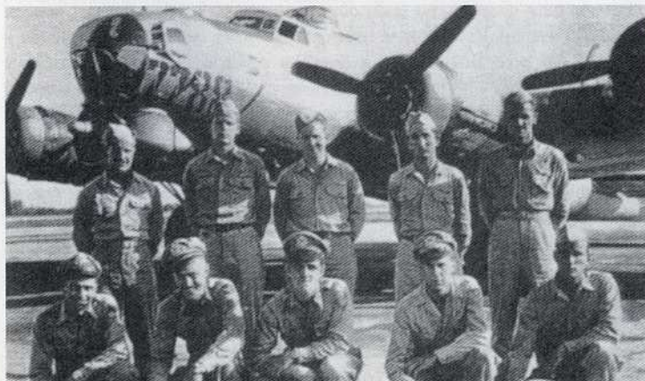
Posadka ameriškega bombnika B17, ki se je 25. decembra 1944 zrušil pri Ivančni Gorici

Še veliko pomembnejša so zavajanja, ki si jih je privoščil pri opisu nenadnega "zajetja" sedemnajstih zavezniških letalcev januarja 1945. Tistega usodnega 19. januarja 1945 je okoli 200 četnikov njegove enote do-