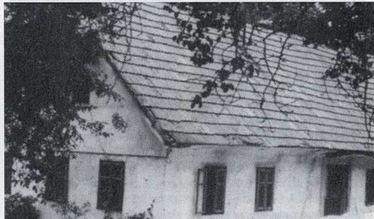
Šuštarjeva hiša v vasi sela pri Pancah, kjer so četniki predali zaveznike Nemcem