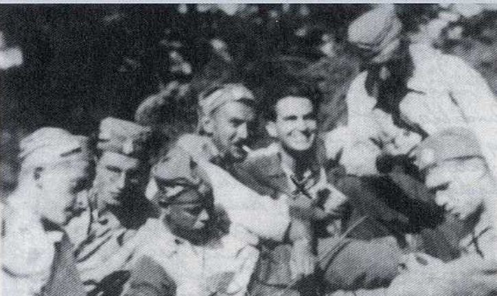
Slovenski četniki v Grčaricah septembra 1943