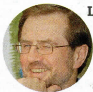
Lojze Peterle , predsednik osamosvojitvene vlade

Vsem, ki so mu v življenju prizadejali krivice, je že davno odpustil, želel pa si je pravico, saj je verjel, da samo ta prinaša narodu svobodo in zdrav napredek. O samostojni Sloveniji je sanjal in si zanjo prizadeval, že dolgo preden je nastala.