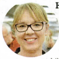
Helena Jaklitsch , ministrica za Slovence v zamejstvu in po svetu, zgodovinarica

Pokojni je bil razumnik širokih filozofskih, gospodarskih, socioloških in teoloških obzorij. Z njimi nas je bogatil v knjigah, člankih in predavanjih. Učil nas je, da je med razvojem in rastjo lahko velika razlika. Bil je človek, v katerem ni bilo zvijače.