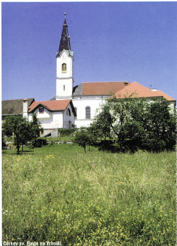
Cerkev sv. Pavla na Vrhniki

1949. Deželi so že štiri leta vladali komunisti. Pobili so na tisoče ljudi, jih na tisoče zaprli, zaplenili so zasebno lastnino... Toda v deželi so še vedno živeli ljudje. In tem je bilo treba vcepiti strah v kosti. Zakaj je danes, pol stoletja kasneje, Slovenija takšna, kot je? Takšna, da so v njej lahko komunisti stopili z oblasti tako, da so se preprosto preoblekli in nam takšni, preoblečeni, vladajo naprej.