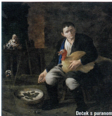
Deček s puranom