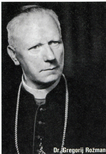
Dr. Gregorij Rozman