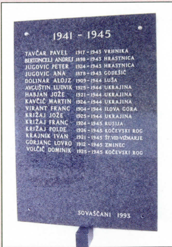
Godešič: borci so na sodišču dosegli odstranitev plošče.