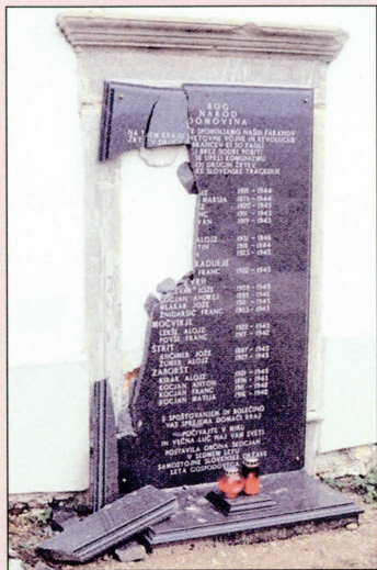
Bučka: komu je bila napotij?

takšnega? V Sloveniji očitno zlahkoto. Potem pa, da bi zakril to svojo nestrpnost, zganja verbalni in interpretacijski terorizem nad ljudmi, ki so bili praktično vse življenje žrtve idejnih očetov te nestrpnosti, in jih obsoja s terminološko povsem nevzdržnimi psovkami, kot so kolaboranti, desničarji, revizionisti. Ti ljudje, vse polno jih je v profesorskih vrstah na naših fakultetah in v publicistiki ter novinarstvu, so svoj nestrpni odnos do drugačnih in drugače mislečih sonarodnjakov v zadnjih letih pripeljali do absurda. Hkrati pa so se pripravljene nenehno angažirati v zagovoru povsem obrobni skupin in tem. Le od česa se ti ljudje počutijo tako ogrožene? Ali je to samo beg pred lastno nestrpnostjo, arogantnostjo, nevedenjem in celo nesposobnostjo?