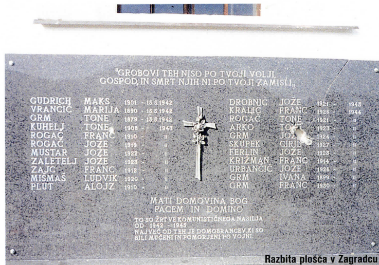
Razbita plošča v Zagradcu