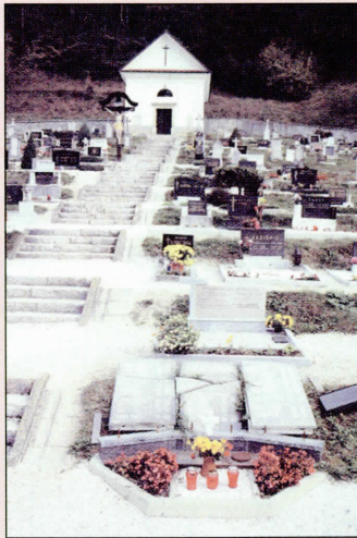
Poljane: po plesu nahujskanih mladostnikov

Ja, takšna je ta naša Cerkev, to ji je ustrezalo, tako je razmišljala in tak-