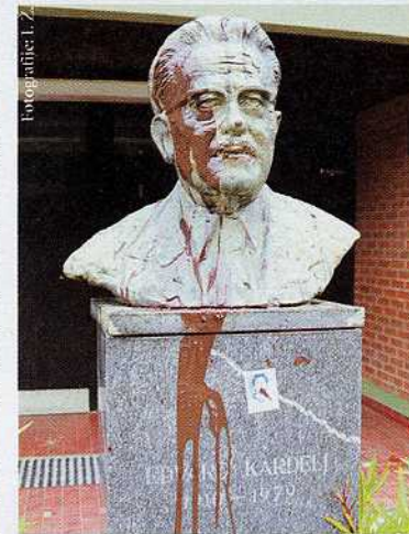
Še vedno! Osnovna šola Rogatec leta 2002 s svojim Kardeljem, ki je neposredno odgovoren za smrt 50.000 Slovencev, za neizmerno gorje, ki ga je morala nacija pretrpeti zaradi njegovih zločinskih projektov, in za današnjo "nekompatibilnost" Slovenije z razvitim svetom.

Spomenka Hribar se že dolgo kaže kot "sredin-