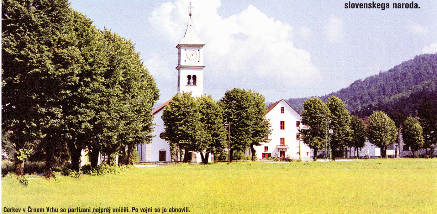
Cerkev v Črnem Vrhu so partizani najprej uničili. Po vojni so jo obnovili.