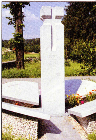
Spomenik Črnovrščanom, ki so jih pobili partizani.