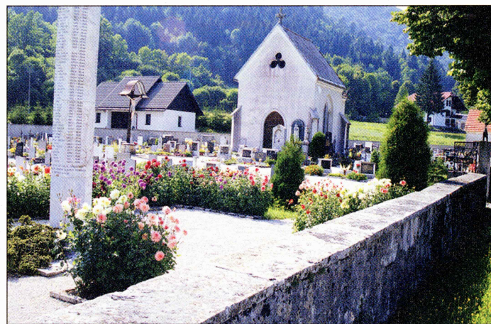
Kje na črnovrškem pokopališču je domobransko grobišče, ki ga je režim po vojni zrvnal z zemljo? Ali si 45 tam pokopanih niti danes, v demokraciji, ne zasluži vsaj skromnega znamenja?

brigad. Za neposredni napad na Črni Vrh so določili Gradnikovo brigado, ki so jo okrepili s 3. bataljonom Kosovelove brigade in "udarnim vodom" Vojkove brigade. Več kot 500 bolj ali manj ideološko fanatičnih borcev torej. Za zavarovanje napada pa so uporabili kar štiri brigade: Kosovelovo, Vojkovo, Prešernovo in Bazoviško. Gradnikovci so se tako lahko mirno posvetili uničenju Črnega Vrha. In to je bilo strašno.