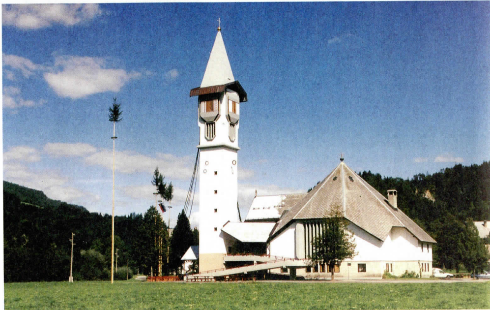
Nova cerkev ni smela imeti visokega zvonika. Šele leta 1997 so ji dozidali današnjega, visokega.