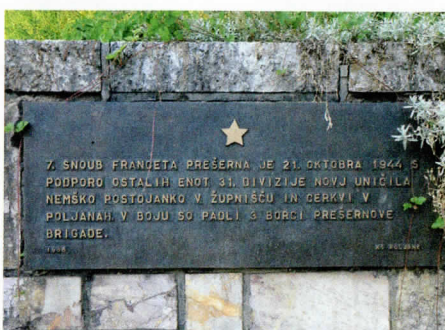
Sredi Poljan, kjer je stala cerkev, napis še leta 2017 pričuje o uničevalcih civilizacije.

3. Z odstranitvijo ruševin bi se dobil v vasi primeren trg, okrog katerega bi bilo možno urediti center vasi, katerega bi zaključ-