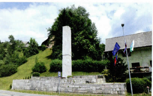
Na mestu uničene poljanske cerkve so komunisti po vojni postavili mogočen spomenik »NOB«.