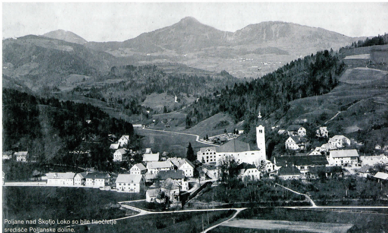
Poljane nad Škofjo Loko so bile tisočletje središče Poljanske doline.

Poljane nad Škofjo Loko so eden tistih krajev, kjer so partizani povsem uničili župnijsko cerkev in veliko župnišče. »Uradno« zaradi boja z okupatorjem, v resnici pa zaradi revolucije in uničevanja, ki je služilo samemu sebi.