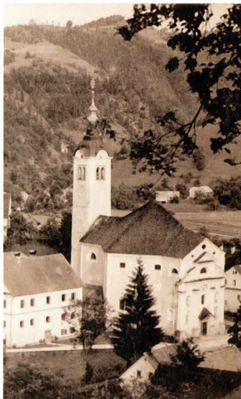
V Poljanah je do partizanskega »napada« stala ena največjih cerkva na Gorenjskem.

Nemški orožniki so po vasi spraševali ljudi, če je kdo slišal 'bandite', ko so vdrli v trgovino. Jezilo jih je to, ker je bilo blago,