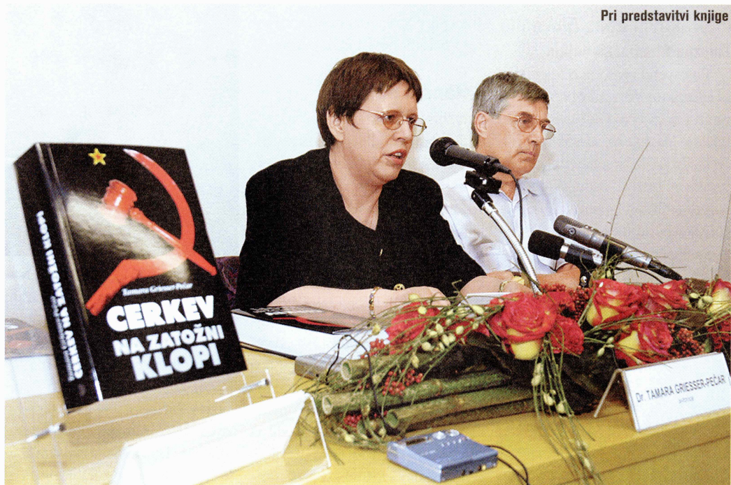
Pri predstavitvi knjige

Kar devetkrat je bila izrečena smrtna kazen in štirikrat je bila tudi izvršena. Poleg tega je bilo upravno kaznovanih 1.411 duhovnikov.